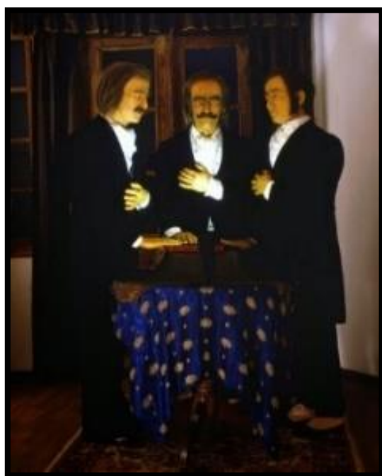
Ίδρυση της Φιλικής Εταιρείας (Μουσείο Κέρινων Ομοιωμάτων Π. Βρέλλη)

Αρχικά υπήρχε η υπόνοια για δήθεν στήριξη της οργάνωσης από μια Μεγάλη Δύναμη (όλοι νόμιζαν ότι ήταν η Ρωσία), ενώ συγχρόνως προχώρησαν στην εγγραφή μελών από τις ελληνικές παροικίες στις Παραδουνάβιες Ηγεμονίες αλλά και στο εξωτερικό.