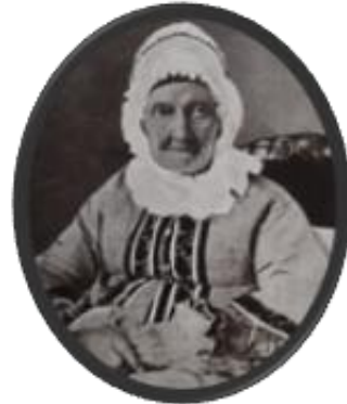
Ελισάβετ Υψηλάντη, μητέρα των Υψηλάντηδων. Διέθεσε όλη την περιουσία της στον Αγώνα.