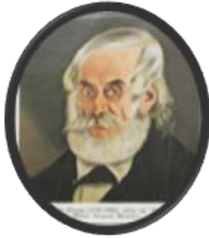
Παναγιώτης Σέκερης, μεγαλέμπορος πρόσφερε μεγάλο μέρος της περιουσίας του στον απελευθερωτικό Αγώνα.

Οι Φιλικοί έκριναν ότι εκεί θα γίνονταν ο σκοπός της οργάνωσης ευρύτερα γνωστός και όλο και περισσότεροι πατριώτες θα βοηθούσαν στον κοινό αγώνα. Η κρίση τους αυτή δεν διαψεύσθηκε, αφού όλο και περισσότεροι Έλληνες γράφονταν στα βιβλία της Φιλικής Εταιρείας προσφέροντας τεράστια ποσά ή μεγάλο μέρος της περιουσίας τους στον Αγώνα.