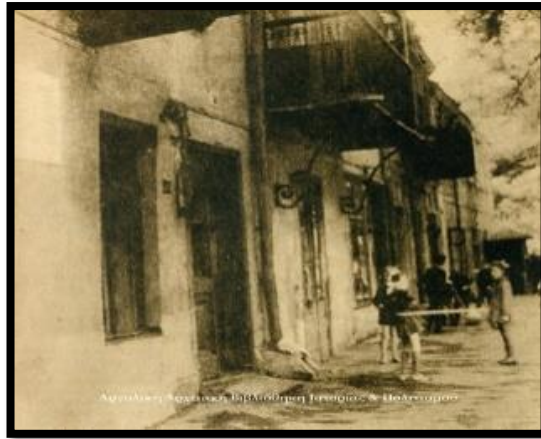
Το σπίτι στην Οδησό, έδρα της Φιλικής Εταιρείας

Ανακαινισμένο λειτουργεί ως Μουσείο της Φιλικής Εταιρείας